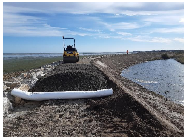
Préparation de la géogrille sur site

Etude par AFITEXINOV en association avec Charier TP.