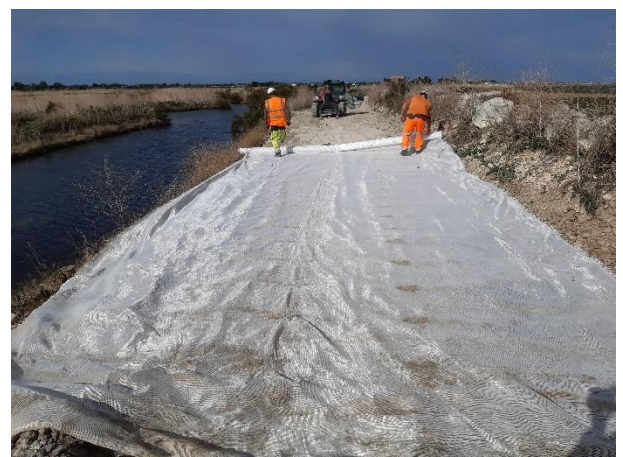
Début du déroulage pour découpe des lès