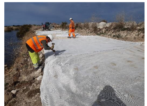
Préparation sur support, découpe et agrafage des géogrilles