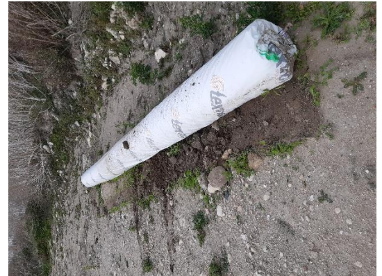
Stockage du NOTEX GX 100-50

La structure du géocomposite NOTEX GX, à base de fines mailles, résulte de l'assemblage par tissage-tricotage-tramage de câbles polymères haute résistance. Il est conditionné en rouleaux de 5 mètres 30 de largeur pour 100 mètres de long. Il est certifié ASQUAL sur plusieurs gammes de résistance.